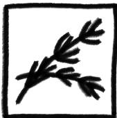
1 TAKJE ROZEMARIJN