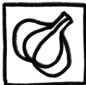
4 TEENTJES KNOFLOOK